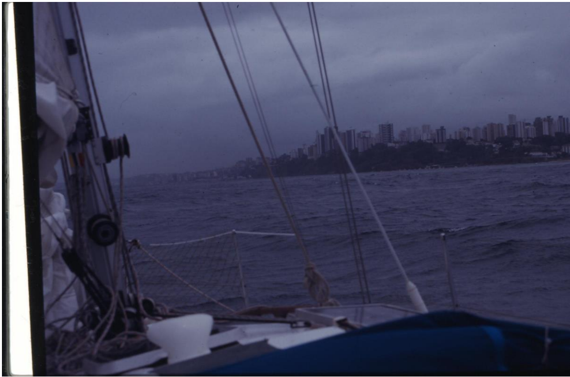
Αφιξη στην Μπαΐα Βραζιλίας