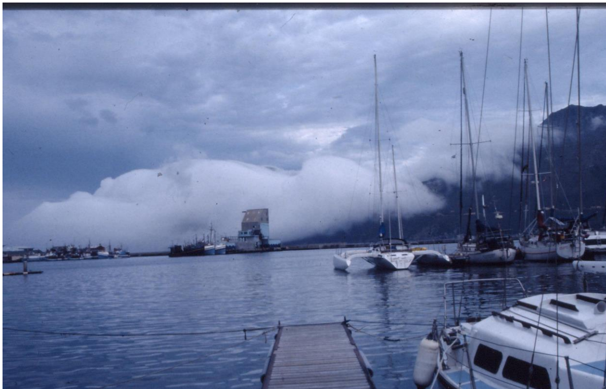
Ακρωτηρίο της Καλής Ελπίδας

μάστιγα των ντόπιων τουριστικών ταχύπλων με τις πατεντάδικες εξωλέμβιες ντίτζελ, που ούρλιαζαν χωρίς εξάτμιση γύρω από το περιβόητο «νησί του Τζέιμς Μποντ».