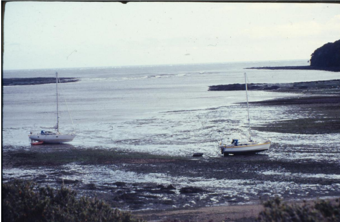
Ανατολικό άκρο της γης του πυρός Μπαΐα θέις