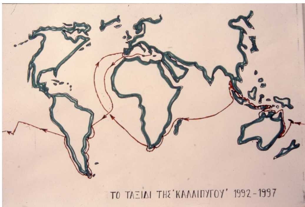
Χειρόγραφος παγκόσμιος χάρτης

Το παρόν έργο πνευματικής ιδιοκτησίας προστατεύεται από τις διατάξεις της ελληνικής νομοθεσίας (Ν. 2121/1991 όπως έχει τροποποιηθεί και ισχύει μέχρι σήμερα) και τις διεθνείς συμβάσεις περί πνευματικής ιδιοκτησίας. Απαγορεύεται απολύτως η άνευ γραπτής αδειάς τον εκδότη κατά οποιοδήποτε τρόπο ή μέσο